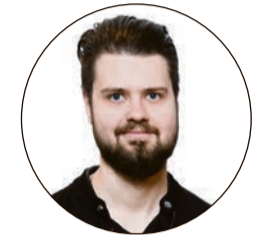
Von Johannes Kaiser Sportredakteur