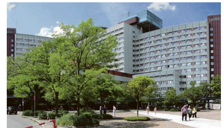
Das Gebäude der Augsburgener Uniklinik ist 40 Jahre alt.