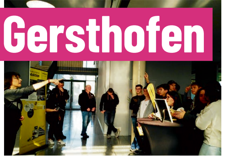
Der Anhänger Spezialist Humbaur zeigte sich rockig und antwortete auf alle Fragen der Teilnehmer.

Nach dem Motto „Nächster Halt: Traumjob“ starteten die Jobbusse vom Gersthofer Rathausplatz zu den beteiligten Unternehmen. Der Jobbus Gersthofen war ein Angebot der Stadt Gersthofen an alle, die sich rund um die Bereiche Praktikum, Ausbildung oder Job informieren wollten. Insgesamt wurden je Tour vier Gersthofer Firmen besucht, sodass jeder Teilnehmer die Möglichkeit hatte, auf einer Tour vier verschiedene Unternehmen kennenzu-