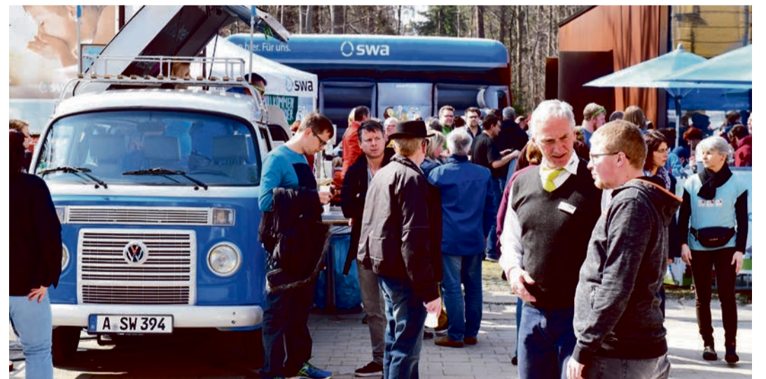
Am Sonntag, 26. März steht bei den swa alles im Zeichen des Wassers. Das Wasserwerk am Hochablass öffnet von 12 Uhr bis 17 Uhr seine Tore. Führungen durch das historische Wasserwerk finden alle 20 Minuten statt.