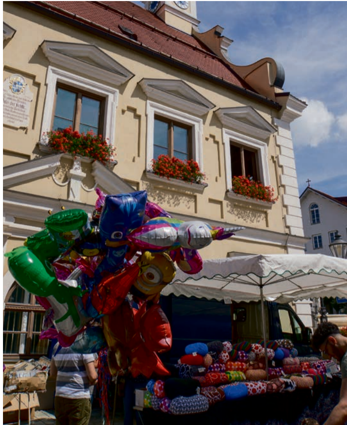
Viel geboten ist am 26. März beim Marktsonntag in Friedberg.