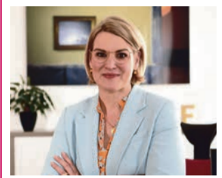
Von OB Eva Weber

Der 22. März ist nicht irgendein Tag. Ihn haben die Vereinten Nationen zum Weltwassertag ausgerufen, um an die Bedeutung der wichtigsten Ressource allen Lebens zu erinnern. Dies ist gerade für Augsburg eine besondere Verpflichtung. Drei Gedanken dazu.