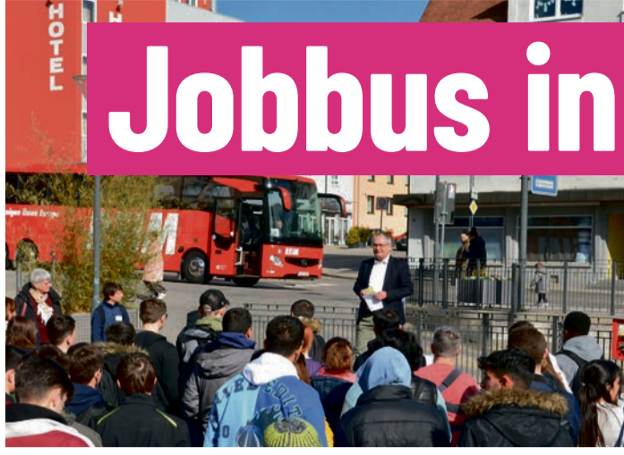
Michael Wörle, Erster Bürgermeister, begrüßte die rund 130 Teilnehmer des Jobbus Gersthofen 2023 persönlich auf dem Rathausplatz.