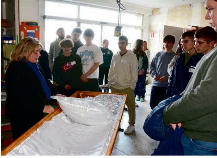
Pius Bestattungen GmbH & Co. stellte den vielseitigen Beruf des Bestatters vor und führte die Teilnehmer durch die Ausstellungsräume und die Werkstatt.