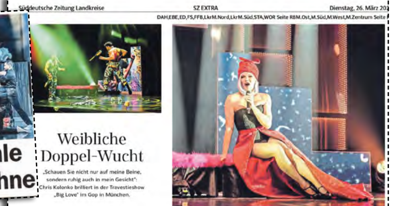
Tolle Kritiken für die Show und „unseren“ Chris gab's vom BR, der Abendzeitung, der tz (v. o.) und der Süddeutschen Zeitung (re.).