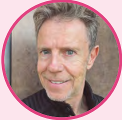
Joachim Schafnitzl Photofactory