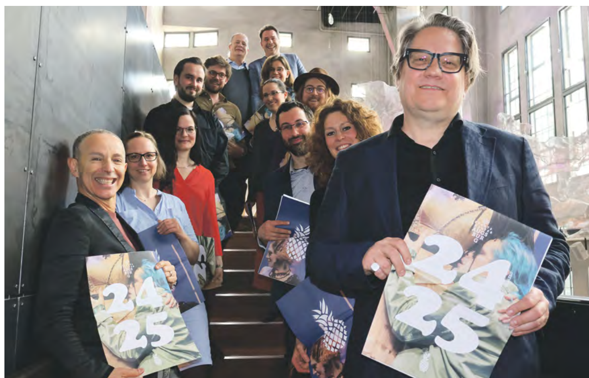
Das Leitungsteam des Staatstheater Augsburgs, mit Intendant André Bückner (re.), startet in die achte Spielzeit des Interims.

Der Kartenvorverkauf für die Spielzeit 24/25 startet am 30. Juni online über www.staatstheater-augsburg.de/spielplan oder beim Besucherservice des Staatstheater Augsburg (Telefon 0821 324 49 00, E-Mail tickets@staatstheater-augsburg.de ). Ebenfalls am Sonntag, dem 30. Juni 2024, findet das Theaterfest im Martinipark statt. Mehr zum Programm: www.staatstheater-augsburg.de/aberwitzig . Das Spielzeitblatt gibt es auch in allen Spielstätten.