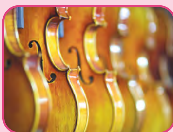
Das 7. Sinfoniekonzert im Kongress am Park.