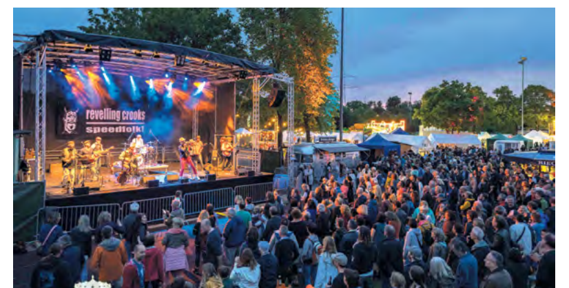
Fünf tolle Tage verspricht das Programm des Stadtberger Stadtfestes.

malt wird das Ganze abends oder alt – Hier ist für jeden etwas von diversen Livebands. Ob jung dabei!