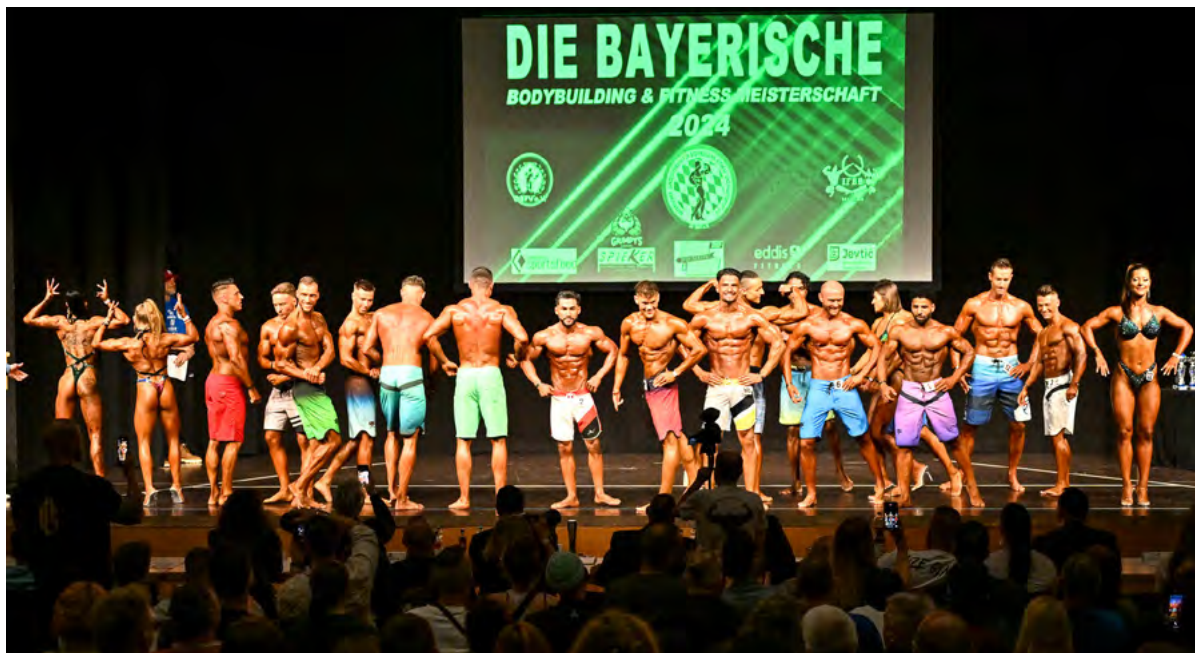
Rund 20 Athletinnen und Athleten zeigten sich, ihre Figur und ihre Muskeln in der Gersthofener Stadthalle bei den Bayerischen Meisterschaften im Bodybuilding.