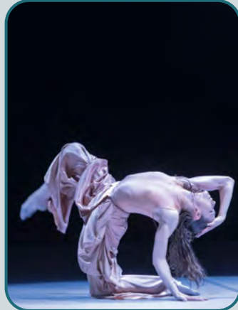
Atemberaubende Momente bietet „Dimensions of Dance. Part 5“.