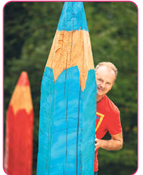
Mit seiner Show „Reimat und Lachkunde“ ist Willy Astor im Kongress am Park zu sehen.