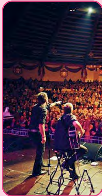
Die Band „Heaven in Hell“ tritt im Augsburger Spectrum auf.