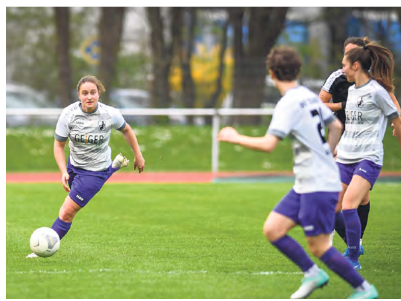
Eine knappe 0:1-Niederlage bezogen die Fußballfrauen von Schwaben Augsburg in der Fußball-Landesliga.

Top-Spiel der Schwaben Augsburg-Fußballfrauen in Ruderting. Die Heimmannschaft kam zu einem knappen 1:0-Sieg, womit der Abstand zu den Tabellenführerinnen aus Augsburg auf fünf Punkte zusammenschmolz. Sollte Ruderting sein Nachholspiel gewinnen, wäre der Kontakt gar wieder hergestellt.