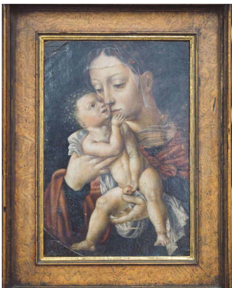
In einer „intimen und liebevollen Szene“ zeigt das Ölgemälde eines unbekanntenen Malers. Originalgröße 30 x 20,5 Zentimeter, die Muttergottes mit dem Jesuskind.