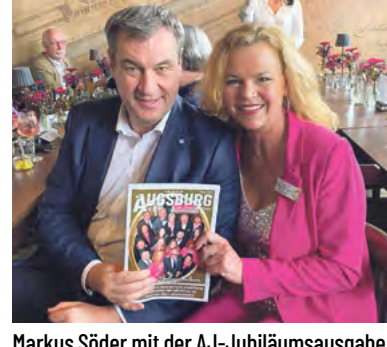
Markus Söder mit der AJ-Jubiläumsausgabe.