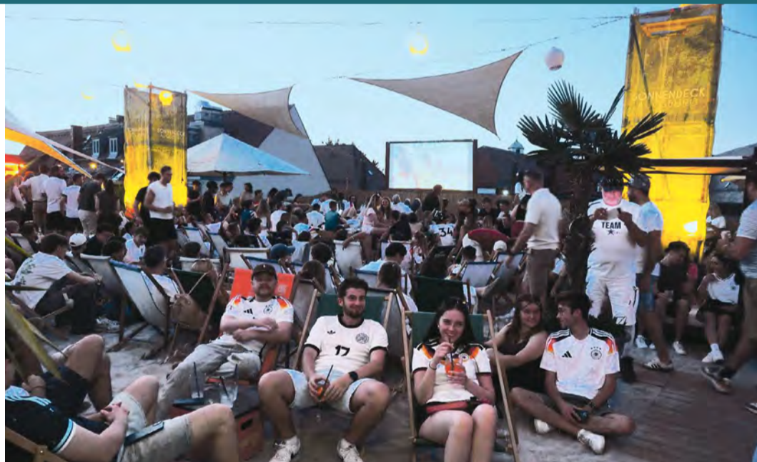
Gemeinsam jubeln unter freiem Himmel: Bei den Augsburger Sommernächten wird das Deutschland-Spiel gegen Ecuador am Donnerstagabend gleich an mehreren Innenstadt-Standorten übertragen.

Für Fans gilt: vorher reservieren oder Webseiten und Social Media checken.