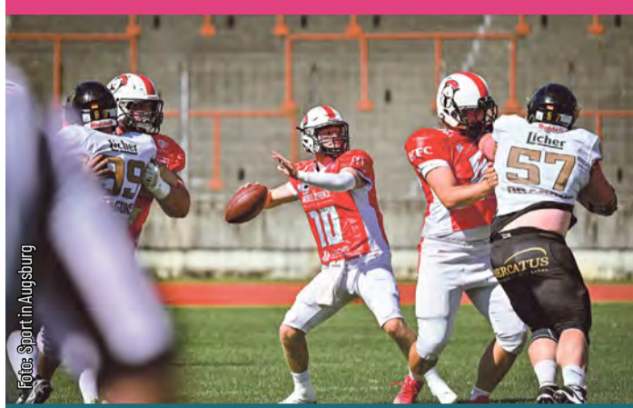
Augsburg Centurions bleiben zu Hause ungeschlagen

Was für eine Willensleistung im Glutofen Rosenaustadion! Bei hochsommerlichen Temperaturen von weit über 30 Grad behielten die Augsburg Centurions im GFL2-Rückspiel gegen die Gießen Golden Dragons einen kühlen Kopf. Mit einem verdienten 31:17-Sieg bauten die Fuggertäter ihre beeindruckende Heimserie aus und festigten ihren Platz in der absoluten Spitzengruppe der Liga.