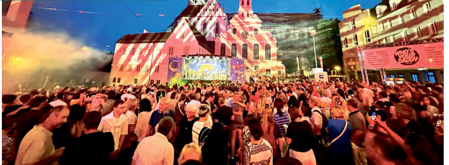
Die swa sind auch bei den achten Augsburger Sommernächten wieder voll im Einsatz und bringen die Gäste mit Bus und Tram sicher zum Fest und wieder nach Hause. Neben kostenlosem Trinkwasser bringen die swa das Fest mit Ökostrom zum Leuchten.

Für alle, die bei ihren Streifzügen durch die Augsburger Innenstadt durstig werden, steht der Wasserbulli am Herkulesbrunnen bereit. Dort schenken Stadtwerkemitarbeitende frisches und naturbelassenes Augsburger Trinkwasser mit und ohne „Blubb“ kostenlos aus. Rund um den Brunnen sind in einer gemeinsamen Fest-Fläche der beiden Hauptsponsoren swa und Stadtparkasse Augsburg neben einigen Überraschungen auch Liegestühle aufgebaut, die zum Verweilen einladen. Darüber hinaus können sich die Besucherinnen und Besucher der Augsburger Sommer-