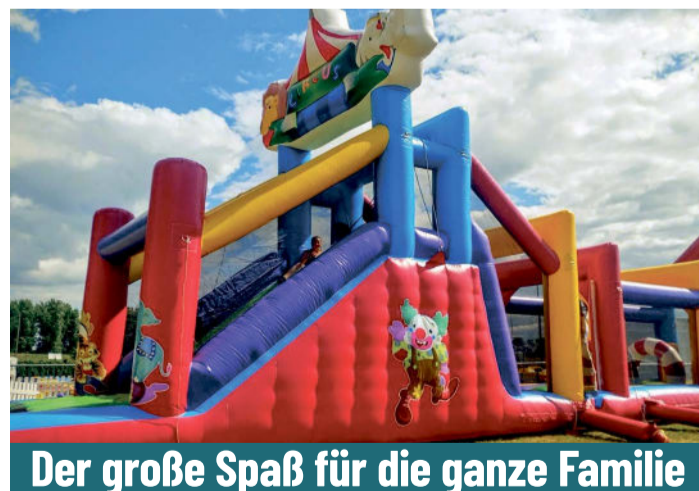
Der große Spaß für die ganze Familie

Die bunten Hüpfburgen sind nicht nur ein Blickfang, sondern bieten auch unzählige Möglichkeiten für Bewegung und Spiel. Von klassischen Hüpfburgen über aufregende Kletterparcours bis hin zu rasanten Rutschen ist für jeden Geschmack etwas dabei. Die Kinder können sich austoben, ihre Energie loswerden