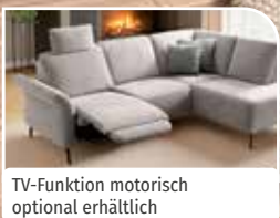
TV-Funktion motorisch optional erhältlich

verschiedene Bezugsstoffe zum individuellen Preis