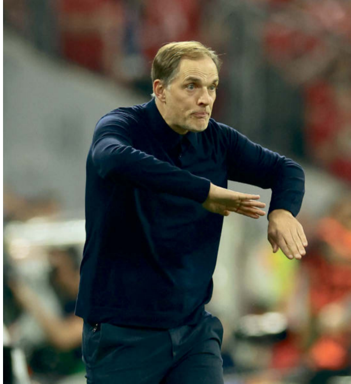
Thomas Tuchel steht mit England im WM-Viertelfinale.

Doch Tuchels Matchplan griff. Angeführt von einem entfesselten Jude Bellingham überrumpelte England die Gastgeber per Doppel-