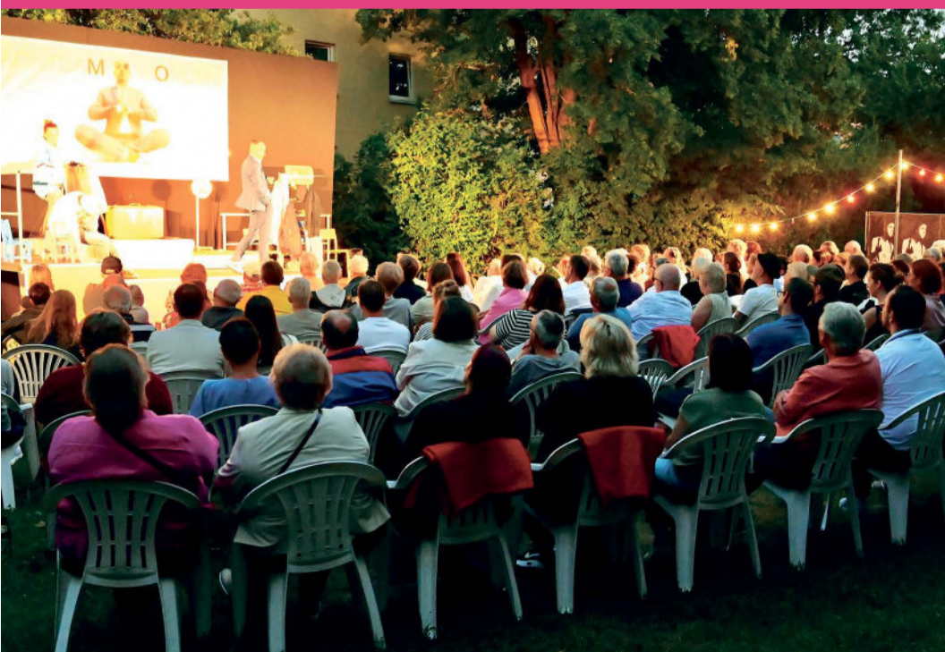
Die Sensemble-Sommerwiese direkt neben dem Sensemble Theater: 100 Zuschauerinnen und Zuschauer finden dort aktuell Platz.